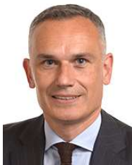
Arnaud Danjean* (Les Républicains / PPE)

Il est secrétaire national d'EELV depuis 2016 et conseiller municipal de Canteleu (Normandie). Il a rejoint les Verts en 1999. De 2007 à 2015, il est conseiller régional de Haute-Normandie.