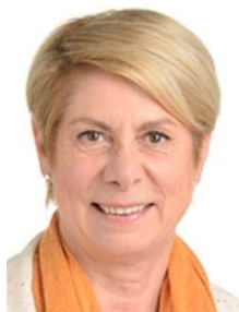
France Jamet* (Rassemblement National / Europe des Nations et des Libertés)

Député européen depuis 2014, il est vice-président du FN en charge des affaires juridiques de 2012 à 2018. Il a été Conseiller régional de Lorraine de 2010 à 2015 et député de la Seine-et-Marne de 1986 à 1988.