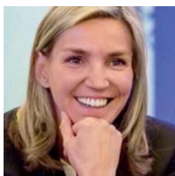
Agnès Evren (Les Républicains / PPE)

Cet avocat d'affaires fait partie des fondateurs d'Europe Écologie les Verts. Il en devient le secrétaire national en 2012, avant de quitter la direction du parti un an après. Député européen depuis 2014, il est impliqué dans les questions de régulation du lobbying et de la lutte contre l'évasion fiscale.