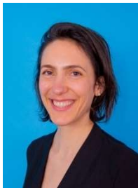
Valérie Hayer (La République en Marche / ALDE)

Élue conseillère régionale de Rhône-Alpes en 1998, elle a présidé la commission santé-solidarité. Adjointe au maire de Lyon, elle est élue au Parlement européen depuis 2009. Elle s'intéresse aux questions d'immigration et d'asile. Depuis 2014, elle est aussi vice-présidente de l'hémicycle.