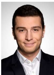
Jordan Bardella (Rassemblement National / Europe des Nations et des Libertés)

Ex-porte-parole de l'ONG Oxfam et enseignante sur les droits de l'Homme à Sciences Po Paris. Tête de liste pour LFI aux élections européennes de 2019, elle s'est engagée pendant ses études à Sciences Po, à l'UNEF, puis a travaillé dans le secteur humanitaire.