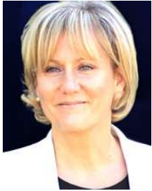
Nadine Morano* (Les Républicains / PPE)

Élue députée de Meurthe-et-Moselle en 2002, elle est membre du gouvernement Fillon de 2008 à 2012. Elle est aussi conseillère régionale de Lorraine. Elle est députée européenne depuis 2014.