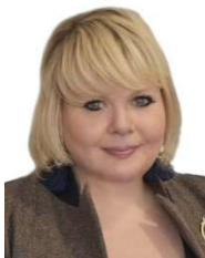
Aurélia Beigneux (Rassemblement National / Europe des Nations et des Libertés)

Il est Député européen depuis 2014. Il dirige la campagne pour les législatives de 2017. La même année, il devient co-président du groupe Europe des Nations et Libertés au Parlement européen, après le départ de Marine Le Pen pour l'Assemblée nationale.