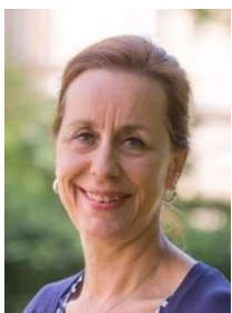
Fabienne Keller (La République en Marche / ALDE)

Océanographe de formation, il est conseiller municipal de Brest et vice-président du Conseil régional de Bretagne depuis 2012, délégué à la mer et aux infrastructures portuaires. Il est élu sur la liste "Pour la Bretagne avec Jean-Yves Le Drian". Il est également conseiller auprès du président de l'Assemblée nationale sur les affaires maritimes, depuis la fin de l'année 2018.