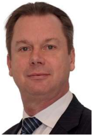
Jérôme Rivière (Rassemblement National / Europe des Nations et des Libertés)

En mars 2018, il rejoint le conseil national du Front National. Il a été député UMP des Alpes-Maritimes de 2002 à 2007. Il a été le directeur de campagne de Philippe de Villiers pour les élections européennes de 2009. Il a adhéré au FN en 2016.