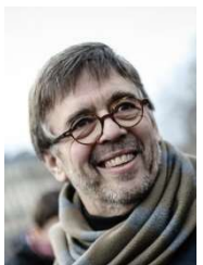
Damien Carême (Europe Ecologie – Les Verts / Verts/ALE)

Ancien directeur de WWF France, il quitte l'organisation pour rejoindre la liste LRM pour le scrutin européen. Il a été ministre délégué au développement sous François Hollande. En 2009, il est troisième sur la liste des Verts pour les élections européennes.