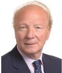
Brice Hortefeux* (Les Républicains / PPE)

Elle est vice-présidente du Conseil départemental de la Mayenne, pour lequel elle est en charge des affaires européennes. De 2016 à 2018, elle est attachée parlementaire auprès du député européen sortant Jean Arthuis.