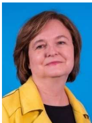
Nathalie Loiseau (La République en Marche / ALDE)

Ministre des Affaires européennes de juin 2017 à mars 2019, elle quitte ses fonctions pour mener la liste LRM pour les élections européennes. Elle a passé une grande partie de sa carrière au Quai d'Orsay dont elle a été directrice générale de l'administration avant d'être nommée à la tête de l'ENA Strasbourg (2012).