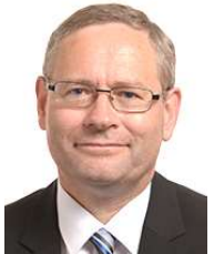
Gilles Lebreton* (Rassemblement National / Europe des Nations et des Libertés)

Fondateur du parti Nouvelle Donne (2013), il le co-préside jusqu'en 2016 puis devient le porte-parole du parti en 2017. Il est conseiller régional d'Ile-de-France de 2010 à 2015.