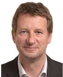
Yannick Jadot* (Europe Ecologie – Les Verts / Verts/ALE)

Il est vice-président de la région Auvergne-Rhône-Alpes, au côté de Laurent Wauquiez, depuis 2016. Il est conseiller régional d'Auvergne de 1992 à 2015. Député européen de 1999 à 2005 et depuis 2011, il est aussi ministre délégué aux Collectivités territoriales entre 2005 et 2007, puis de l'Immigration (2007-2009) et enfin de l'Intérieur (2009-2011).