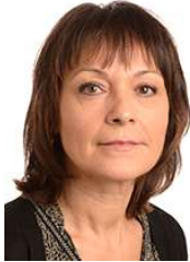
Sylvie Guillaume* (Parti socialiste – Place publique / S&D)

Élue conseillère régionale de Rhône-Alpes en 1998, elle a présidé la commission santé-solidarité. Adjointe au maire de Lyon, elle est élue au Parlement européen depuis 2009. Elle s'intéresse aux questions d'immigration et d'asile. Depuis 2014, elle est aussi vice-présidente de l'hémicycle.