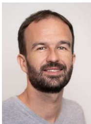
Manuel Bompard (La France Insoumise / GUE/NGL)

Directeur de campagne de Jean-Luc Mélenchon pour l'élection présidentielle en 2017, il débute son engagement au sein du Parti de gauche en 2008. Il est diplômé d'un doctorat de l'Office national des Etudes et Recherches Aérospatiales et travaille depuis 2014 au sein d'une start-up dans le secteur de l'intelligence artificielle.