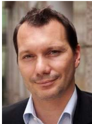
David Cormand (Europe Ecologie – Les Verts / Verts/ALE)

Avocat, il est député depuis 2012 à l'Assemblée nationale et secrétaire général du RBM depuis 2012. Il est membre du conseil stratégique de la campagne présidentielle de Marine Le Pen de 2017.