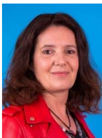
Irène Tolleret (La République en Marche / ALDE)

Il est directeur de la campagne d'En marche pour les européennes depuis janvier 2019. Après la campagne présidentielle, il a rejoint l'Élysée en tant que conseiller politique.