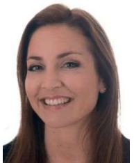
Julie Lechanteux (Rassemblement National / Europe des Nations et des Libertés)

Ancien professeur d'université, spécialiste de droit administratif et des libertés publiques, il est le conseiller enseignement supérieur de Marine Le Pen. Il devient député européen en 2014. En février 2018 il est désigné chef de la délégation RN au Parlement.