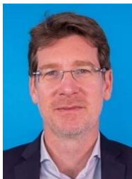
Pascal Canfin (La République en Marche / ALDE)

Ancien directeur de WWF France, il quitte l'organisation pour rejoindre la liste LRM pour le scrutin européen. Il a été ministre délégué au développement sous François Hollande. En 2009, il est troisième sur la liste des Verts pour les élections européennes.