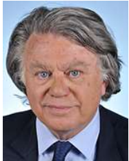
Gilbert Collard (Rassemblement National / Europe des Nations et des Libertés)

Conseillère municipale de la ville de Metz et vice-présidente du Conseil départemental de la Moselle, elle rejoint la liste des Républicains pour les élections européennes en tant que représentante des Centristes.