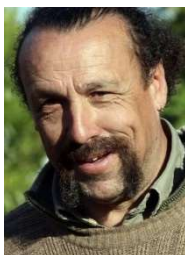
Benoît Biteau (Europe Ecologie – Les Verts / Verts/ALE)

Commerçante de profession, elle est conseillère régionale de Lorraine depuis 2010.