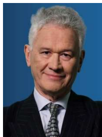
Hervé Juvin (Rassemblement National / Europe des Nations et des Libertés)

Née le 11 décembre 1973, elle est juriste. Elle rejoint le Front national en 2013. Elle est élue conseillère régionale du Grand-Est en 2015 et elle préside le groupe régional du RN depuis 2017.