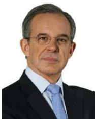
Thierry Mariani (Rassemblement National / Europe des Nations et des Libertés)

Ministre des Affaires européennes de juin 2017 à mars 2019, elle quitte ses fonctions pour mener la liste LRM pour les élections européennes. Elle a passé une grande partie de sa carrière au Quai d'Orsay dont elle a été directrice générale de l'administration avant d'être nommée à la tête de l'ENA Strasbourg (2012).