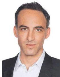
Raphaël Glucksmann (Parti socialiste – Place publique / S&D)

Il est conseiller politique en Géorgie de 2004 au début des années 2010. En 2017, il est chroniqueur sur France Info et France Inter. Il lance avec plusieurs autres personnalités le mouvement Place publique en octobre 2018.