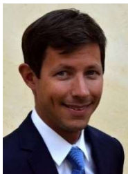
François-Xavier Bellamy (Les Républicains / PPE)

Il a travaillé dans plusieurs cabinets ministériels, notamment auprès de Rachida Dati et Nathalie Kosciusko-Morizet. Il est maire adjoint de la ville de Versailles (Yvelines) depuis 2008, délégué à l'emploi, la jeunesse et l'enseignement. Il est professeur de philosophie et auteur de plusieurs ouvrages.