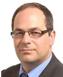
Emmanuel Maurel* (La France Insoumise / GUE/NGL)

Maire de Valréas de 1989 à 2005, il est député du Vaucluse de 1993 à 2012, puis des Français de l'étranger de 2012 à 2017. Il est ministre des Transports de 2010 à 2012. Il quitte Les Républicains en janvier 2019 et rejoint la liste RN pour les Européennes.