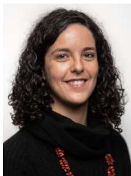
Manon Aubry (La France Insoumise / GUE/NGL)

Ex-porte-parole de l'ONG Oxfam et enseignante sur les droits de l'Homme à Sciences Po Paris. Tête de liste pour LFI aux élections européennes de 2019, elle s'est engagée pendant ses études à Sciences Po, à l'UNEF, puis a travaillé dans le secteur humanitaire.