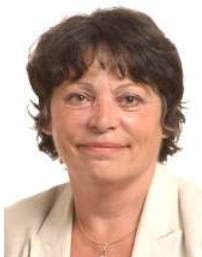
Michèle Rivasi* (Europe Ecologie – Les Verts / Verts/ALE)

Il est maire de Valenciennes en 2002 à 2012. Il est député européen depuis 2009, membre du groupe ALDE. Il appartient au Mouvement radical. Premier Vice-président de la commission des transports et du tourisme, il s'est beaucoup investi sur réforme ferroviaire (4e paquet).