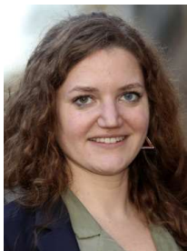
Marie Toussaint (Europe Ecologie – Les Verts / Verts/ALE)

Elle est juriste en droit international de l'environnement. Elle est membre des conseils d'administration de la Fondation verte européenne et de la Fondation pour l'écologie politique. Fin 2018, elle a lancé l'appel « L'affaire du siècle » contre l'État pour « inaction climatique ».