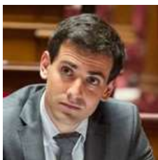
Stéphane Séjourné (La République en Marche / ALDE)