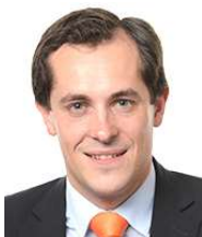
Nicolas Bay* (Rassemblement National / Europe des Nations et des Libertés)

Né en 1995, il est conseiller régional d'Ile-de-France depuis 2015. Il est secrétaire départemental du FN en Seine-Saint-Denis depuis 2014 et porte-parole du RN depuis 2017.