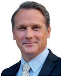
Philippe Olivier (Rassemblement National / Europe des Nations et des Libertés)

Élue députée de Meurthe-et-Moselle en 2002, elle est membre du gouvernement Fillon de 2008 à 2012. Elle est aussi conseillère régionale de Lorraine. Elle est députée européenne depuis 2014.